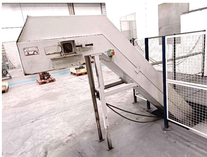
Extractor de virutas / Chip conveyor.