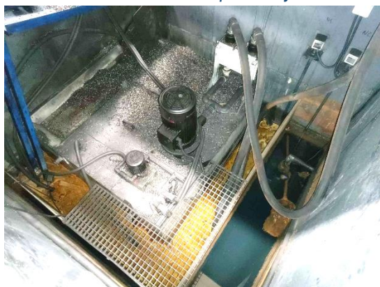
Bomba alta presion / high pressure pump