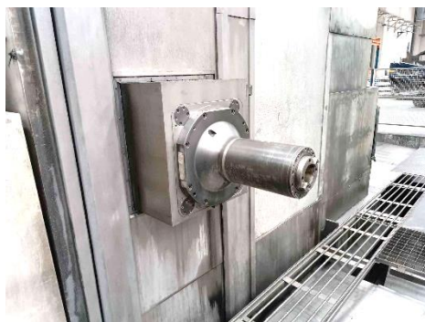
Cabezal de mandrinar salida directa / milling direct output head