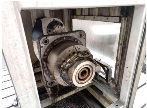
Cabezal ortogonal indexable /indexable orthogonal head