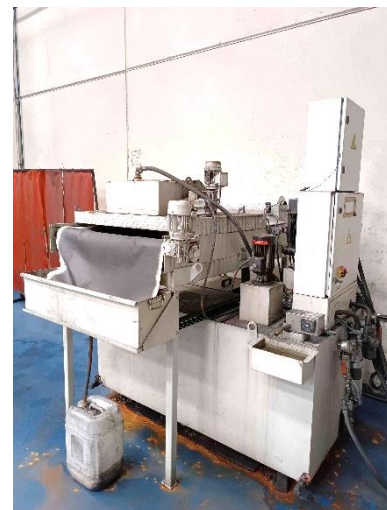
Deposito filtro de papel / paper filter tank