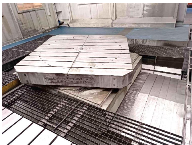
Mesa rototraslante vasculante motorizada \pm 5^\circ DEMMELER mod. DRALT2500 2500 x 2500 mm. / motorised rotary-translating Table with motorised tilt-table \pm 5^\circ DEMMELER mod DRALT2500. 2500 X 2500 mm.