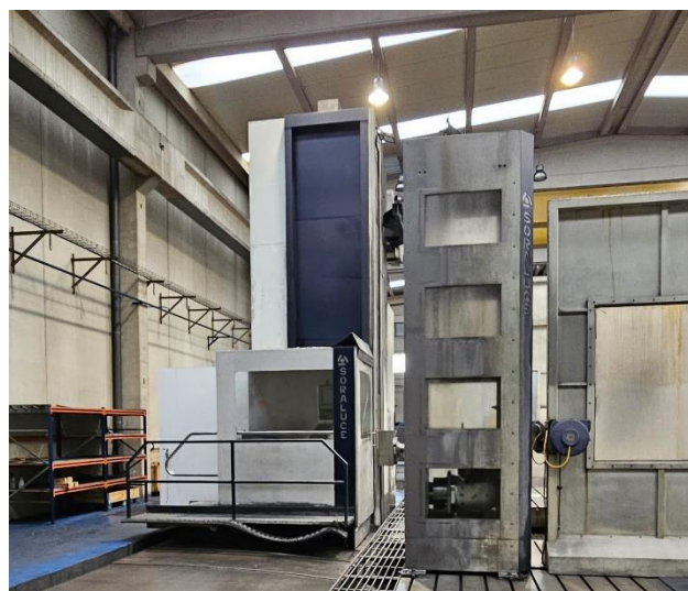
Pick-up cabezales / Pick-up of heads: